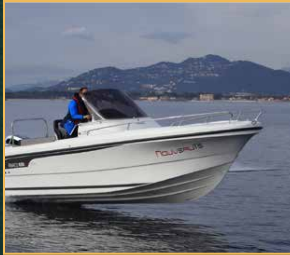
قارب صغير للرحلات الاستكشافية الخاصة