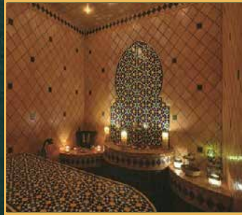
حمام مغربي علاج شرقي تقليدي