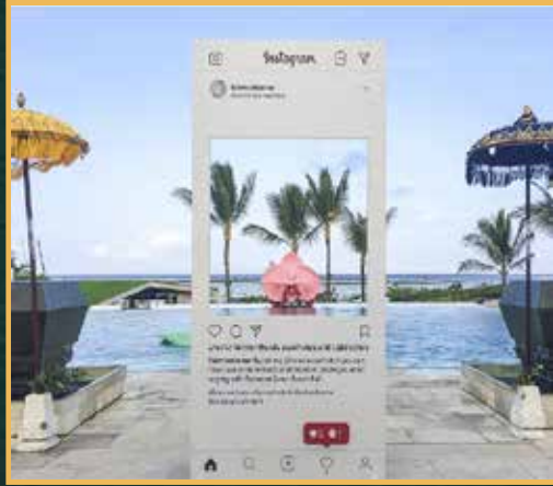
فوتوبوث مصمم بهوية منتجج القصور