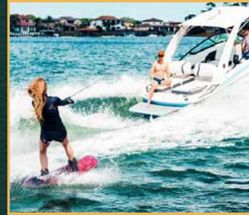
التزلج ركوب الأمواج على لوح تزلج أثناء جره من مركبة بالخلف