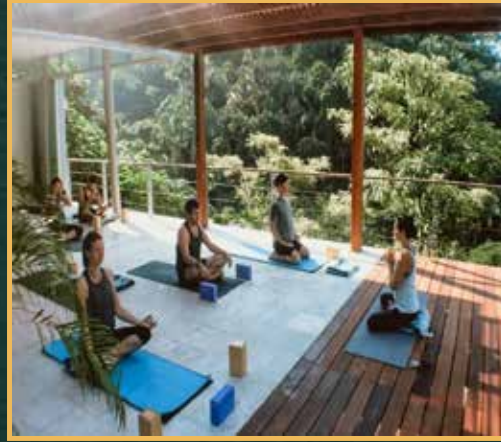
يوجا جلسات يوجا متعددة مثل يوجا الين التأمل، البيلاتس مع مدربين معتمدين للاتصال الروحي والطاقة الإيجابية والاسترخاء