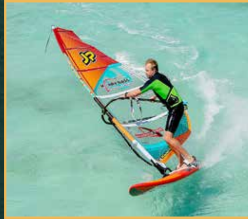
لوح شراعي (Windsurfing) ركوب الأمواج على لوح شراعي