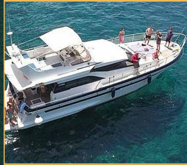
رحلات بحرية - قارب رحلات للمجموعات من الممكن أن تكون رحلات خاصة