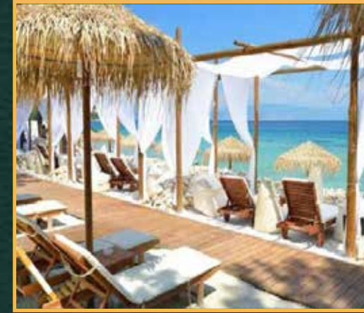
كراسي الشاطئ مع ستائر حرير تمثل فخامة الماضي وانعزال لتجربة فريدة