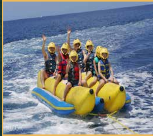
بانانا بوت قارب نفخ يجر في الماء على سرعة عالية