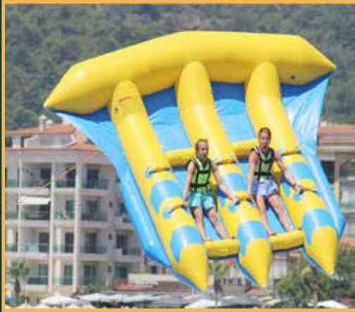
بانانا بوت طائر قارب نفخ يجر في الماء على سرعة عالية بطريقة الطائرة الورقية