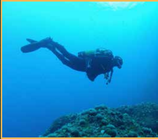
الغوص السياحة تحت الماء مع معدات الغوص الخاصة