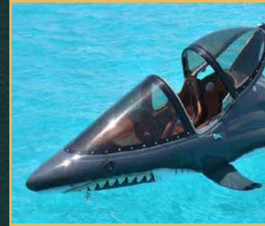
سي بريشر مركبة مائية بمقعدين على شكل سمكة قرش