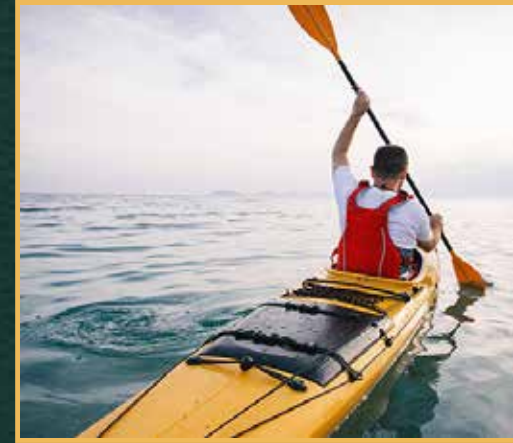
كايك - تجديف بالقارب