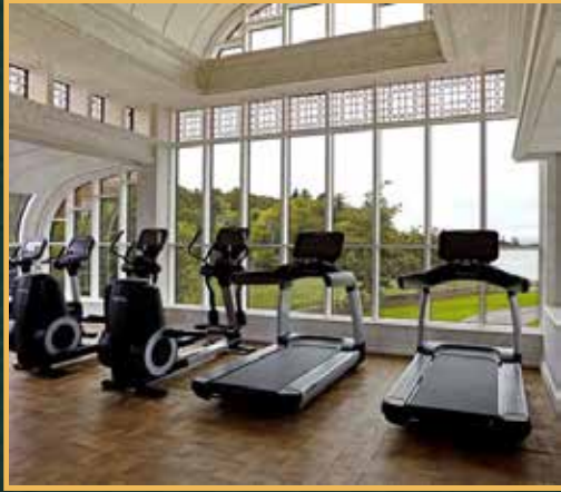
نادي رياضي أحدث معدات اللياقة مع مدرب شخصي لمتابعة الاهداف