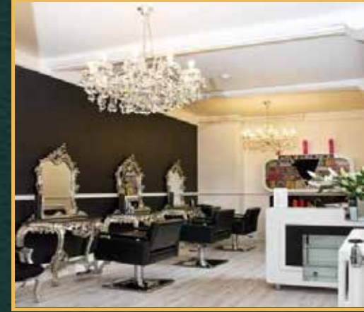
صالون تجميل جميع خدمات الشعر بأفخم العلاجات والأدوات لإكمال تجربة الدلال