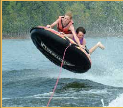
Tubing قارب مدور يجر من مركبة