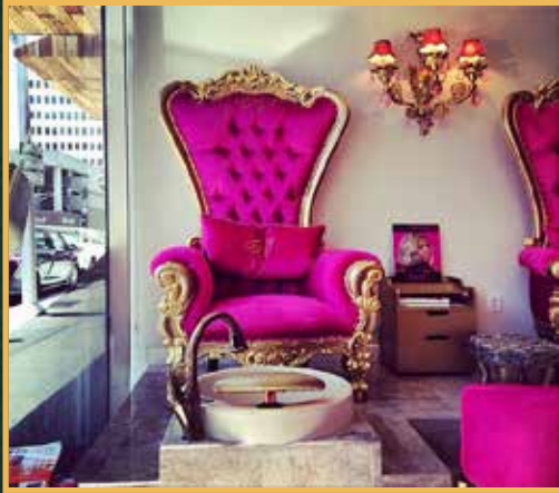
مانيكير وباديكير متعة احترافية مع زيوت عطرية لجمال الاظافر