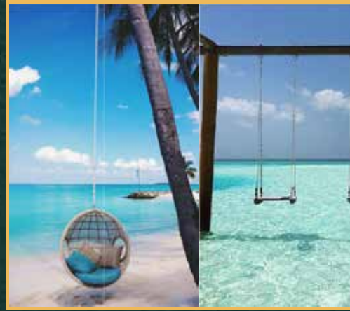
أرجوحة في الماء أو على غصن شجرة