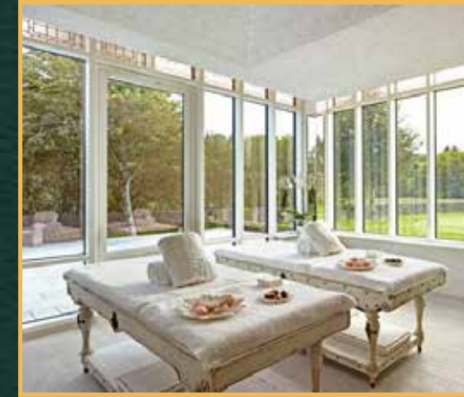
غرفة مساج الاستمتاع بمجموعة من العلاجات كالمساج والتقشير والحجامة