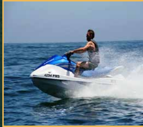
زلاجة مائية (Jet Ski) مركبة على سطح الماء وتعمل مثل الدراجة النارية